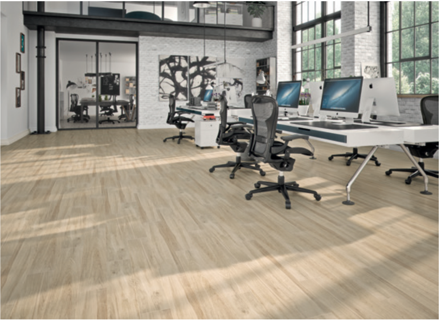
Natural (Beige Pâle)